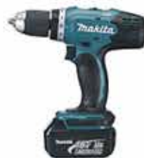
Aku vrtací skrutkovač DDF453SYE

Vŕtanie alebo skrutkovanie. Celokovová konštrukcia prevodovky zaručuje trvanlivosť prevodov. Dodávané s 2 batériami a nabíjačkou. Batéria Li-ion 1,5 Ah.