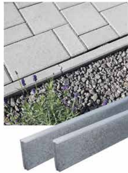
Obrubník sivý parkový, 1 m