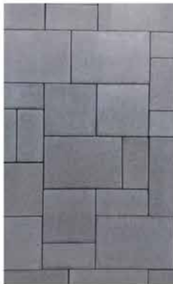
Top Zóna kombi, 6 cm