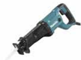
Elektrická chvostová píla JR3051TK

Elektrická chvostová píla 230 V s vysokou účinnosťou rezania. Príkon – 1200 W, max. priemer drevo – 255 mm, max. priemer rúrka – 130 mm. Hmotnosť – 3,3 kg. Dodávané v plastovom kufri.