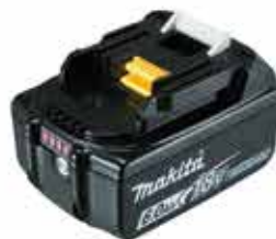
Akumulátor BL1860B, 6,0Ah Náhradný akumulátor pre stroje.