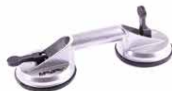
Prísavka MasiPro 125 mm, dvojdielna

Služí na prenášanie manipuláciou a usadzovanie materiálov s rovným povrchom, napr. obklady, dlažby, sklo, plast, kov a pod.