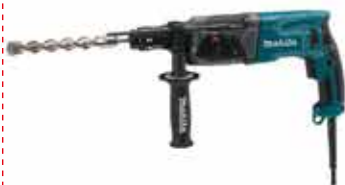
Elektrické vrtacie kladivo HR2470T

Výmena hlavice SDS-PLUS a rýchloupínacieho skľučovadla bez použitia náradia. Príkon: 780 W, príklep: 2,4 J, max. vrtací výkon – oceľ/betón/drevo:13/24/32 mm, hmotnosť: 3 kg.