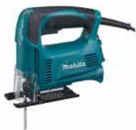
Píla elektrická priamočiara 4327

Priamočiara píla s reguláciou otáčok. Príkon – 450 W, počet kmitov za minútu – 500 – 3.100 min -1 , max. rezný výkon drevo/ocel – 65/6 mm.