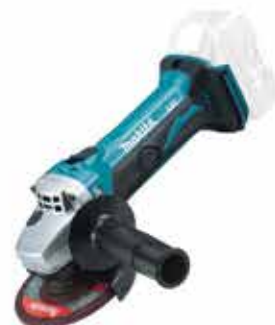
Aku uhlová brúska Li-ion DGA452Z

Uhlová brúska s nabíjačkou MAKSTAR so systémom optimálneho dobíjania. Priemer kotúča – 115 mm, voľnobežné otáčky – 10 000 min -1 , menovité napätie batérie – 18 V.