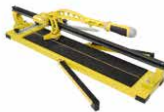
Rezačka Lobster easy-cut, 60 cm

Vystužená, robustná kovová konštrukcia. Šírka základne 175 mm, hrúbka kovu 1,8 mm. Pevná vodiaca lišta. Ergonomická rukoväť, osadená štyrmi ložiskami. Rezačné koliesko s ložiskom 22 x 6 x 10,5 mm. Rezanie do hrúbky s uhlomerom.