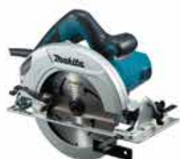
Okružná píla HS7601

Ergonomicky tvarovaná prídavná rukoväť. Výkonný 1 200 W motor. Robustná základová platňa s nastavením hĺbky rezu na princípe svorky. S možnosťou pripojenia na vysávač. Príkon – 1 200 W, priemer kotúča 190 mm, hmotnosť 4,0 kg.