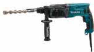
Elektrické vrtacie kladivo HR2470

Príkon: 780 W, príklep: 2,4 J, max. vrtací výkon – oceľ/betón/drevo:13/24/32 mm, hmotnosť: 2,9 kg, upínanie SDS-PLUS.