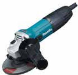
Elektrická uhlová brúska GA5030R

Kompaktná a výkonná jednoručná brúska s hmotnosťou len 1,8 kg. Príkon – 720 W, priemer brúsneho kotúča – 125 mm, voľnobežné otáčky – 11 000 min -1 .