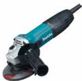
Elektrická uhlová brúska GA4530R

Kompaktná a výkonná jednoručná brúska s hmotnosťou len 1,4 kg. Príkon – 720 W, priemer brúsneho kotúča – 115 mm.